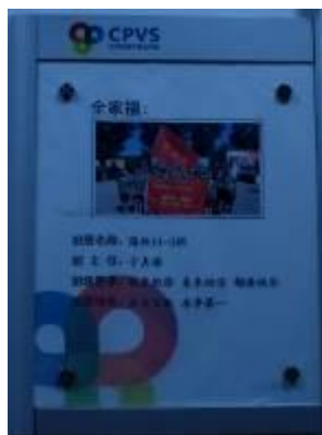
教室门前的班级全家福