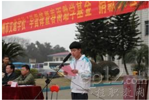
图为获资助学生代表发言

我校自 1995 年成立春雨助学基金以来，累计收获捐款 185797 元，资助学生 1650 人次，让贫困学生感受学校大家庭的温暖，同时还保障了他们顺利完成学业。