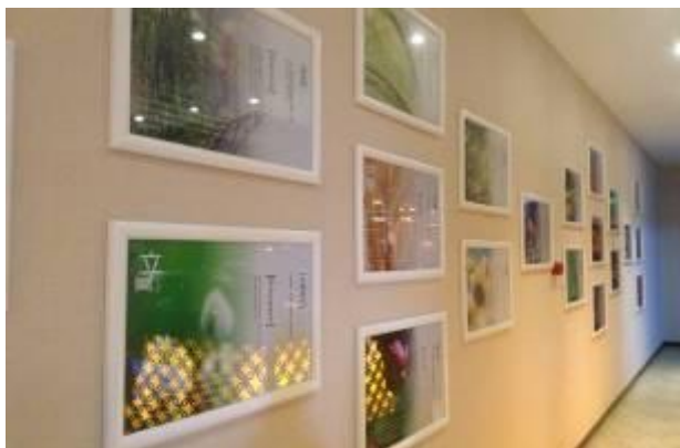
图为旅游专业实训基地-“三生苑”一角

昌平职校借 55 周年校庆，校史馆所展现出来的校园文化建设成果令人震撼，无处不彰显“追求卓越、锲而不舍”的昌职精神，以“113290”为建设目标培养德艺双馨的教师队伍，构建教师能“站得稳讲台、开得好车床、找得准市场、做得了项目”教学质量监控体系，创新“三有”课堂教学模式。