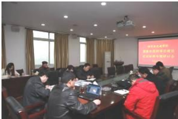
图为佐证材料专题研讨会现场