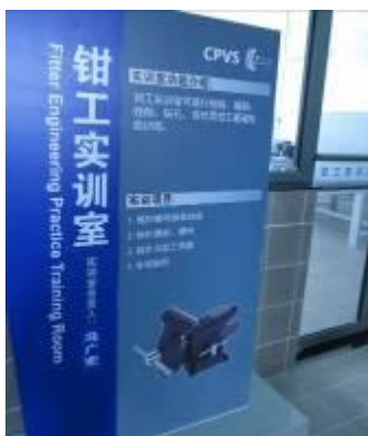
中德汽车文化交流中心 统一的实训室标志

短短 5 天时间，我们系统学习了北京昌平职校示范校项目建设“CPVS”经营学校理念及相关办学经验，参观了航空服务实训室、中德汽车文化交流中心、获英国皇家园艺协会认定的蝴蝶兰园林花卉基地、市民终身学习烹饪专业实训基地、城市轨道等实训场所，学校统一的建筑外墙颜色、统一校园文化场所标语给我们留下了深刻印象，充分领略了昌平“一校、一部、三园区”的发展格局。