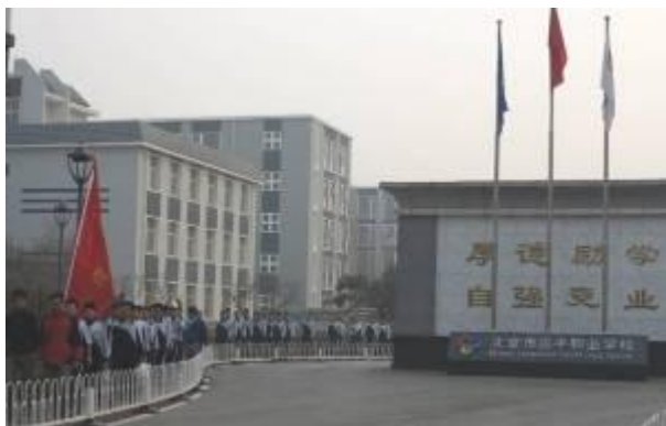
举着班旗靠右行走的学生队伍

德育副校长赵东生用一个个鲜活的案例讲述了作为职业德育教育工作者的艰辛，而职业教育应遵循“厚德、励学、自强、竞业”的校训，本着“把需要工作的人培养成工作需要的人”的理念，指导、引领学生成长。举着班旗自觉地靠右行走的学生、课间广播操整齐的入场队列、乒乓球馆热汗挥舞的学生笑脸，是对全校德育工作者最好的肯定。