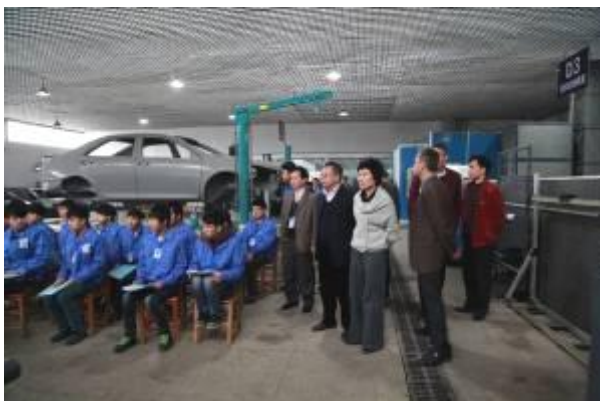
图为校领导陪同专家组观摩课堂教学

专家们本着“查问题、促提高”的宗旨，重点查找问题、指出错漏、指导提高。专家组首先察看了学校实训基地、教室等场所，然后，听取学校及项目小组的汇报并认真查看了项目建设佐证材料。在意见反馈会上，指出了我校目前的总结报告、典型案例存在提升不够高、佐证材料支撑力度不够强等问题，并提出了相应的整改思路。