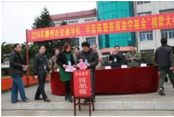
图为在校长、书记的带领下 学校各科室、社团、班级代表依次捐款