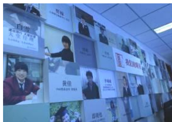
实训室里的优秀毕业生的笑脸墙

昌平职校借 55 周年校庆，校史馆所展现出来的校园文化建设成果令人震撼，无处不彰显“追求卓越、锲而不舍”的昌职精神，以“113290”为建设目标培养德艺双馨的教师队伍，构建教师能“站得稳讲台、开得好车床、找得准市场、做得了项目”教学质量监控体系，创新“三有”课堂教学模式。