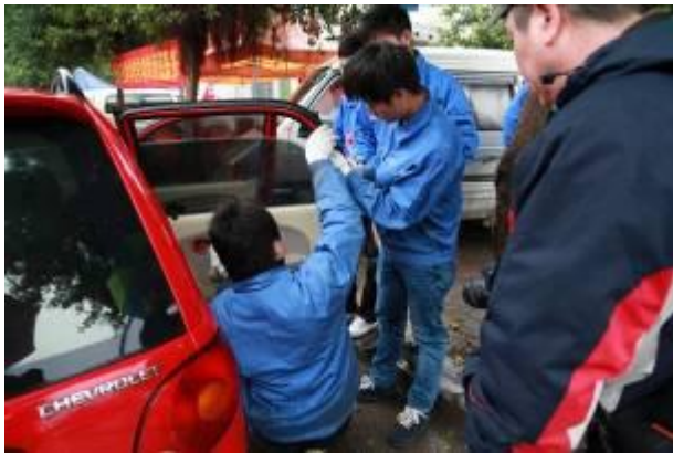
图为同学们帮助社区居民的检修小轿车