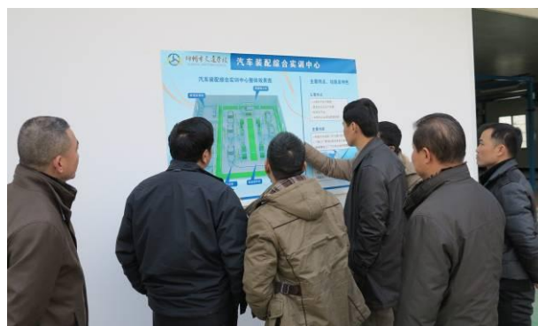
图为陆总监向韦院长一行介绍 汽车装配综合实训中心建设情况

韦院长一行对我校立足地方产业，深入开展校企合作的经验与做法给予了充分肯定，并表示将参考我校做法进一步加快与柳工路创公司等区内企业合作，为进一步深化我区职业院校校企合作共建做出更大努力。