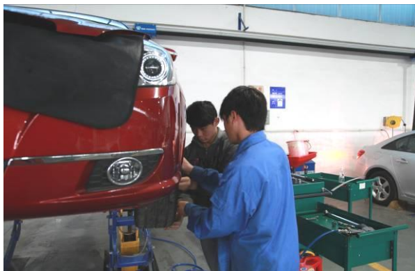
图为学生正在进行二级维护训练

2014年2月8日，年味尚浓，我校今年参加区级、市级中等职业学校技能比赛的师生就放弃了与家人的团聚，早早返校展开了紧张有序的工作和训练。