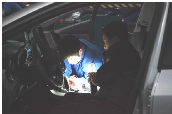
图为学生在老师指导下进行个人排故训练

今年是我校全面建成国家示范校的关键一年，我校力争在今年的区级、市级中等职业学校技能比赛中再创佳绩，这不仅有利于彰显学校的办学实力，还可以借此机会代表广西参赛队在全国比赛中再获荣誉，将学校示范效果辐射全区、乃至全国。