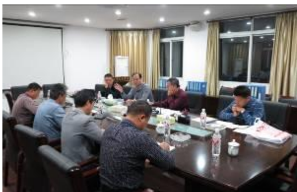
图为专家组在对评估进行反馈

定了我校专业建设所取得成绩，特别是校企合作成果显著，鼓励学校结合国示范校建设推进专业建设，同时，也提出了建设不足及整改意见。最后，冯明源校长做总结发言，感谢专家组对我校工作的肯定和对我校提出的宝贵意见，并表示我校将存在的问题逐条研究、逐一解决，切实将示范专业建设落到实处。