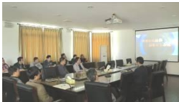
图为廉政视频学习现场

视频以案例的形式剖析了党员干部失德、失范的严重后果，警示党员干部。通过此次活动，全校党员干部进一步加强了思想修养，进一步增强了反腐倡廉的自觉性，提高了拒腐防变和抵御风险的能力。