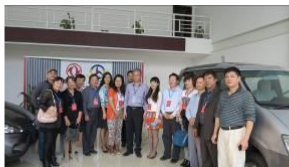
图为我校领导与政协委员合影