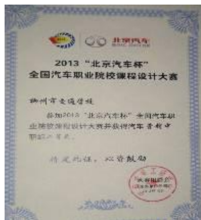
图为学校获奖证书

本次教师教学技能大赛分为中职营销、中职维修、高职营销和高职维修四个组，赛程分为初赛和全国决赛两个阶段。在初赛的“课程设计、现场说课”环节中，我校代表队从初赛的129支队伍中脱颖而出，入围本次决赛。并在决赛“课程设计、现场说课和上课”环节中表现优异，获得评委好评。